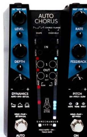
Salikti “AUTO Series” (iepriekš MOD) produkta prototipi